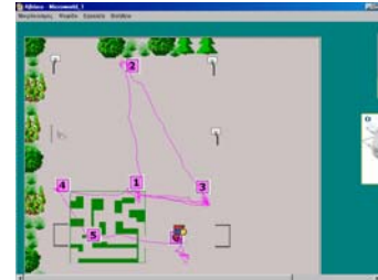
Εικόνα 1. Παιχνίδια με τα σχήματα (Pattern 1)