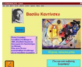
Εικόνα 1: Σελίδα-οθόνη της εφαρμογής σχετικά με τον V. Kadinsky